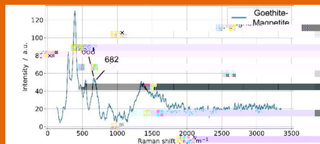
Fig.2 -Spettro Raman della miscela magnetite-goethite identificata sul campione CH_02 / Raman spectrum of the magnetite-goethite mixture identified on the sample CH_02.

È importante sottolineare che la magnetite presenta deboli picchi caratteristici che, talvolta, ne impediscono una corretta identificazione, soprattutto se presente in minima quantità all'interno di una miscela con la goethite. Infatti, in accordo con precedenti studi [13], si evidenzia il problema della sovrapposizione dei picchi: in particolare, si potrebbe avere una sovrapposizione tra il picco caratteristico della magnetite posizionato attorno a 670 \text{cm}^{-1} ed un picco caratteristico della goethite posizionato attorno a 685 \text{cm}^{-1} (Fig.2). In questo caso, si identificano entrambi i picchi, presupponendo una sufficiente quantità di magnetite tale da essere correttamente identificata.